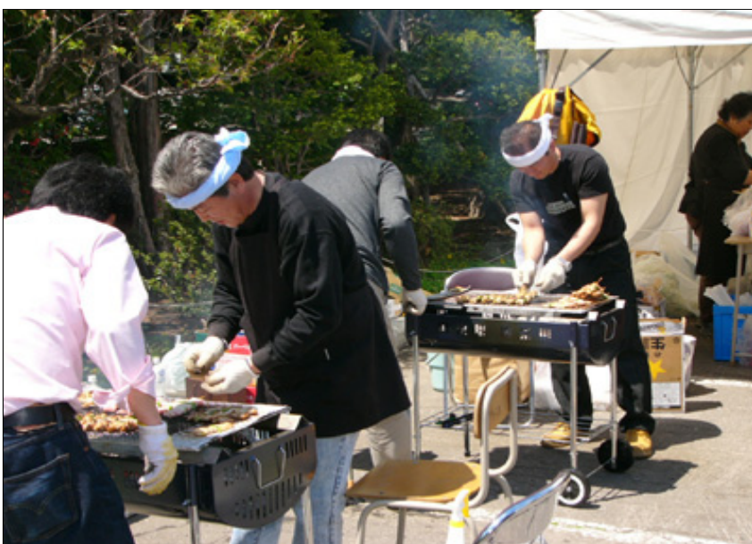
【会場にて】 焼き鳥やおでんなべ・焼きそばとお祭り気分を味わえました。