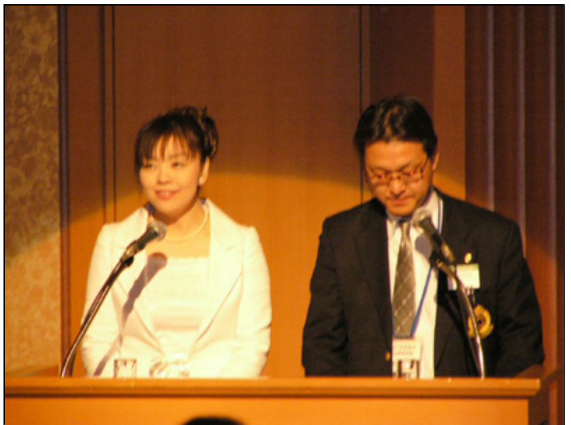
【式典】いよいよ式典のスタート