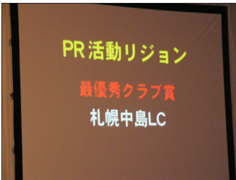
【式典】 1個目のアワード「PR活動リジョン 最優秀クラブ賞」