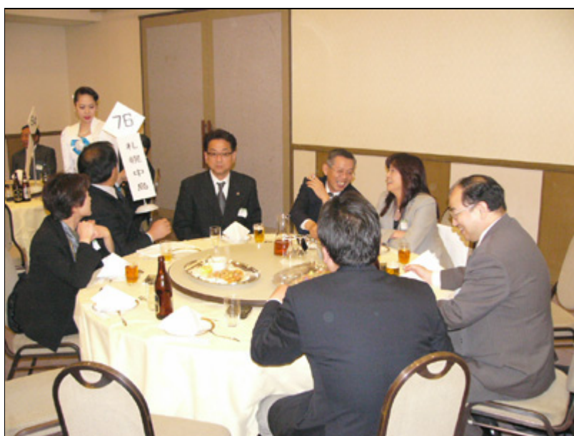
【懇親会】参加した中島ライオンズのメンバーテーブル写真1