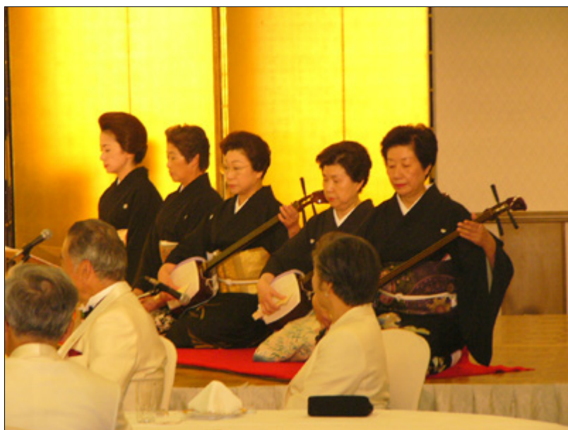
【懇親会】祝舞「蓼三番叟」札幌見番 2