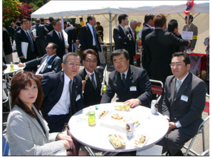
【会場にて】 屋外で記念撮影。大瀧L・津村会長・井原L・竹谷L・広野L