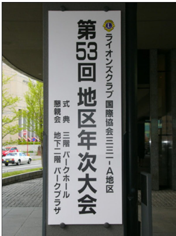
【会場にて】会場入口