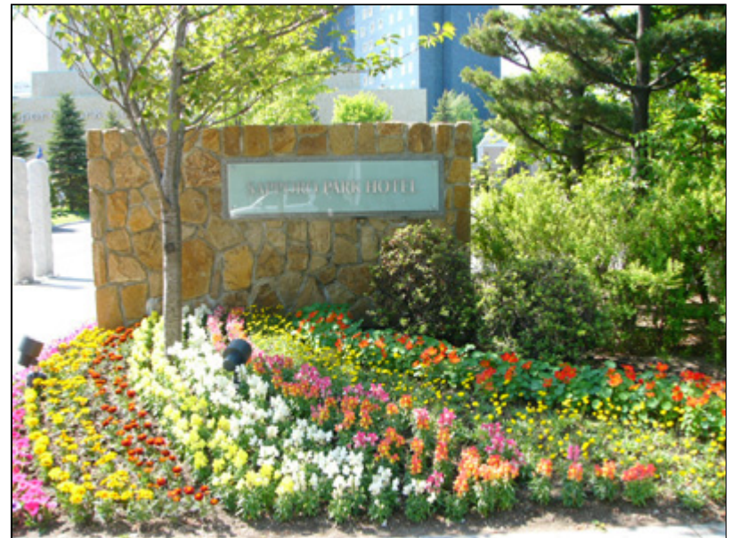
【会場にて】本年度会場は札幌パークホテルです。