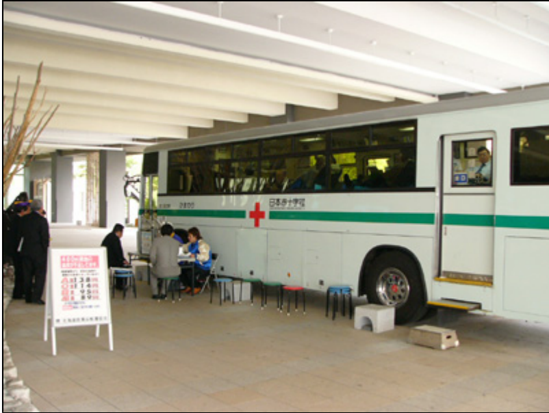
【会場にて】 毎年恒例の献血です。 会員1名400ccの協力をしました。