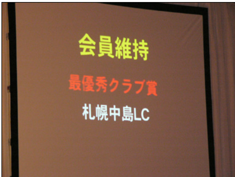
【式典】 3個目のアワード「会員維持 最優秀クラブ賞」