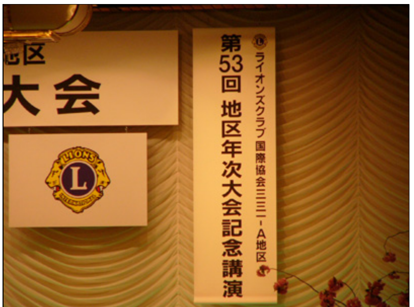
【式典】 記念講演 中野浩一様