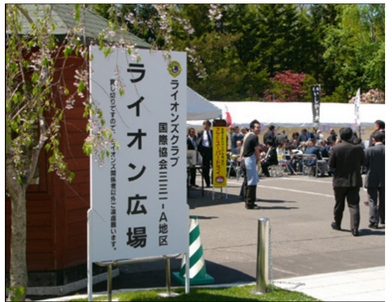
【会場にて】 受付風景駐車場を「ライオン広場」として設営