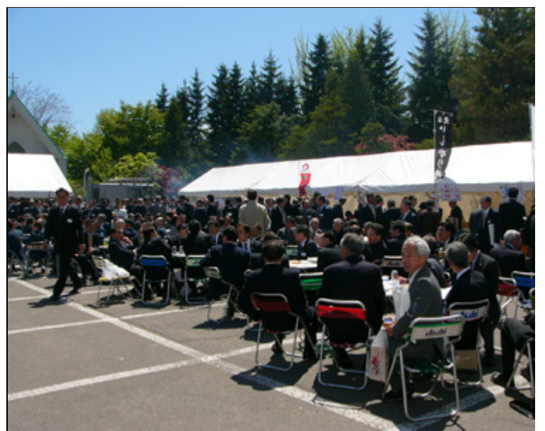
【会場にて】 会場風景