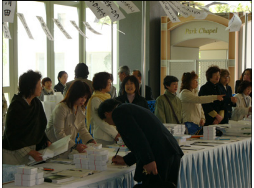
【会場にて】 受付風景