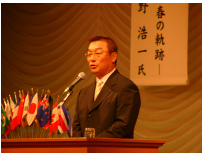
【式典】大変面白く、楽しい講演ありがとうございました。