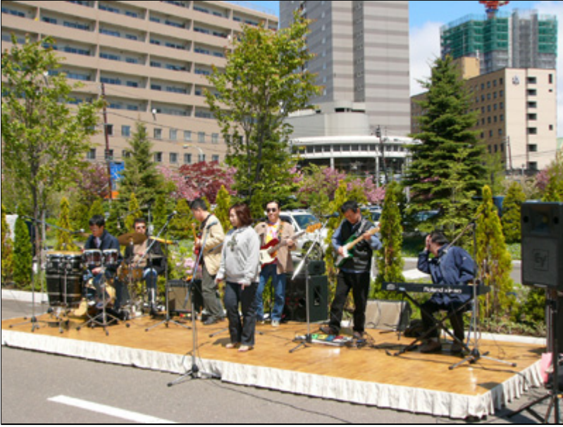
【会場にて】 生バンドの演奏もありました。