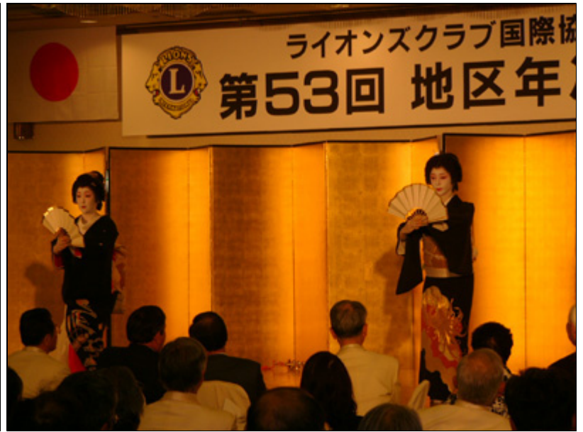
【懇親会】祝舞「蓼三番叟」札幌見番 1