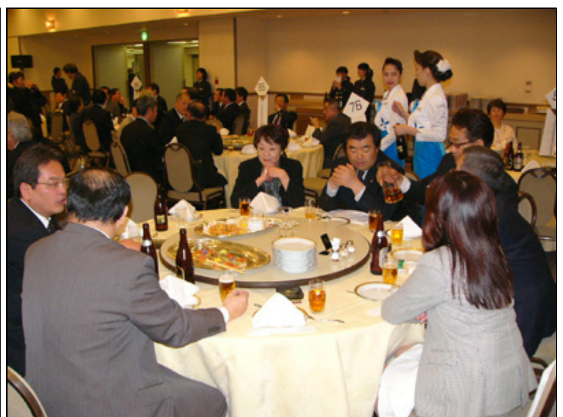
【懇親会】参加した中島ライオンズのメンバーテーブル写真2