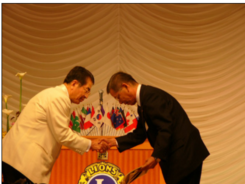
【式典】 壇上でガバナーとの握手