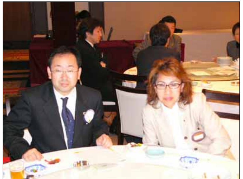
札幌東LCのメンバーの方々