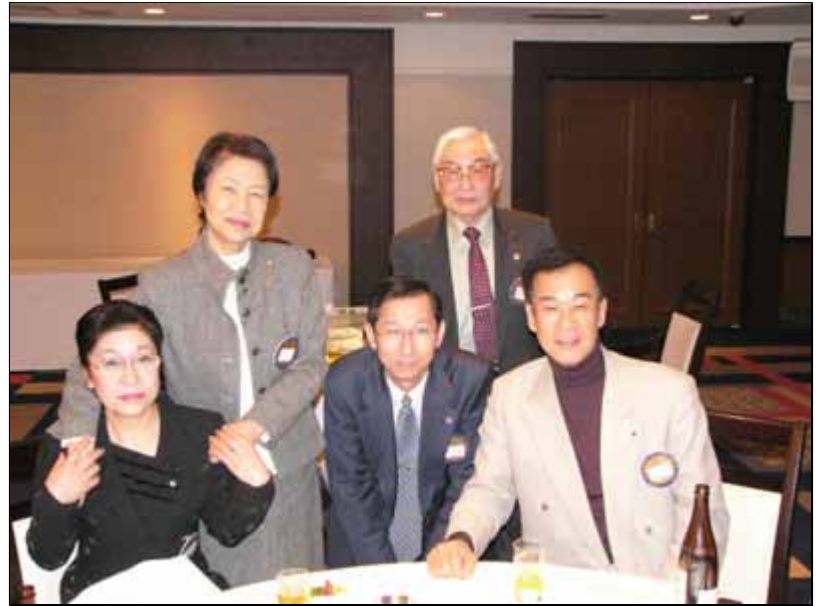
札幌東LCのメンバーの方々