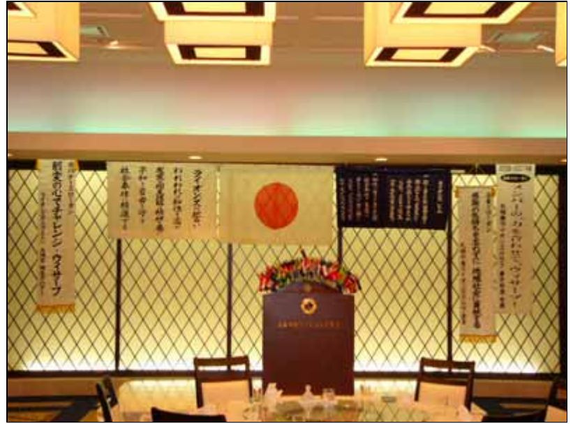
札幌東LC・札幌中島LC会長スローガン