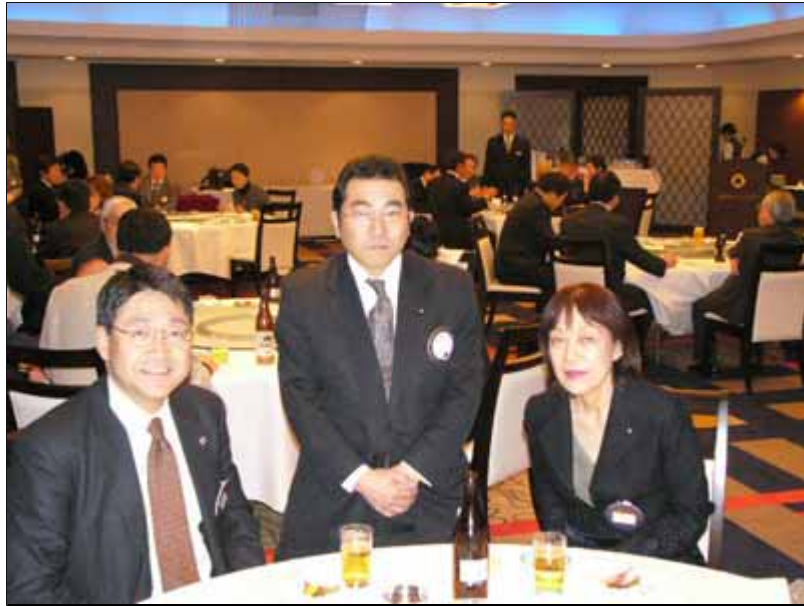
広野Lと札幌東LCの方々