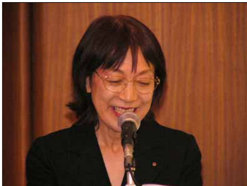
札幌東LCライオンテーマ田上Lによる司会進行