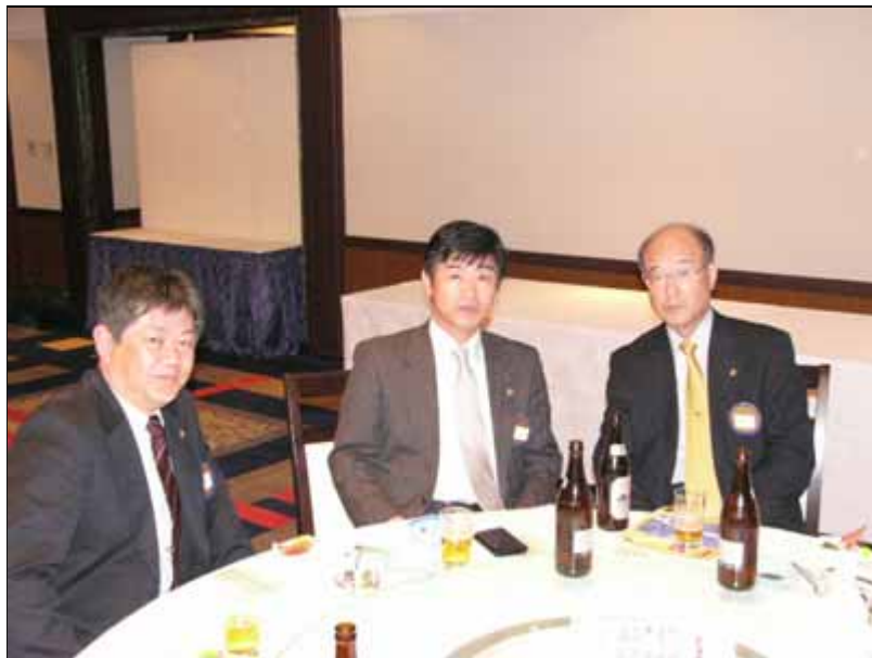
札幌東LCのメンバーの方々