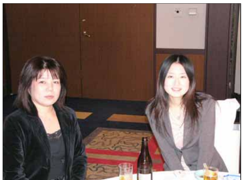
両クラブの事務局員さん本日はお疲れ様でした