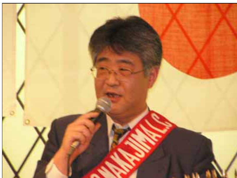
矢部Lによるテールツイスタータイム