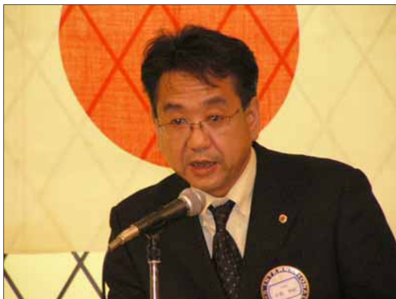
井原幹事による「審議・報告事項」