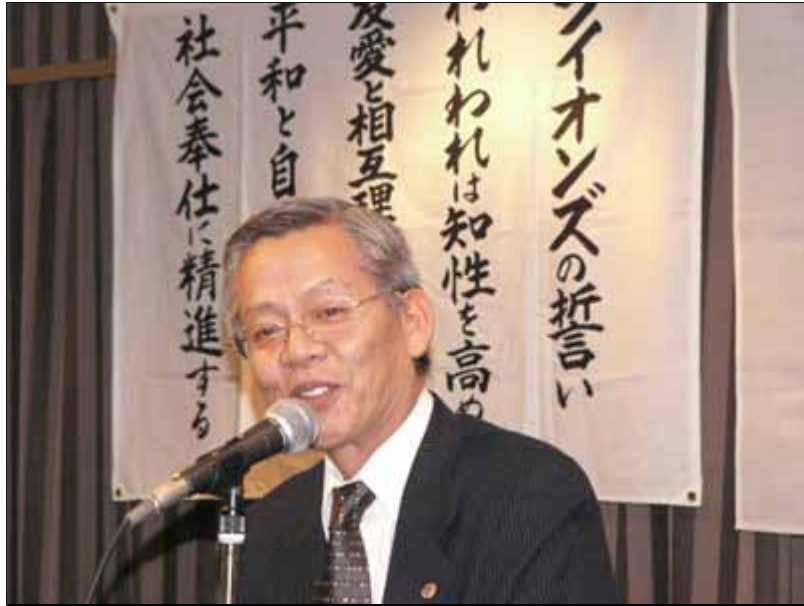
津村現会長のスピーチ「旅立ち編」