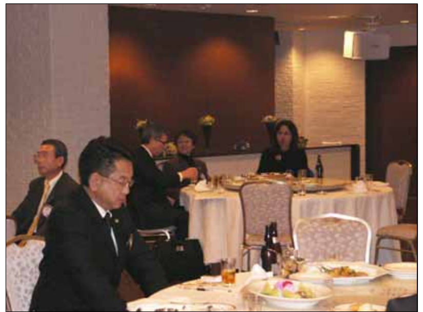
井原幹事も本日は「ゆったり」