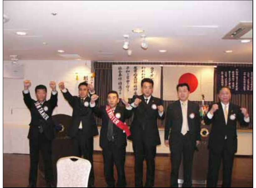
1日役員全員によるローア