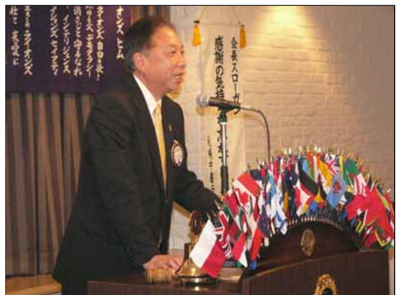
大森1日会長による「閉会ゴング」