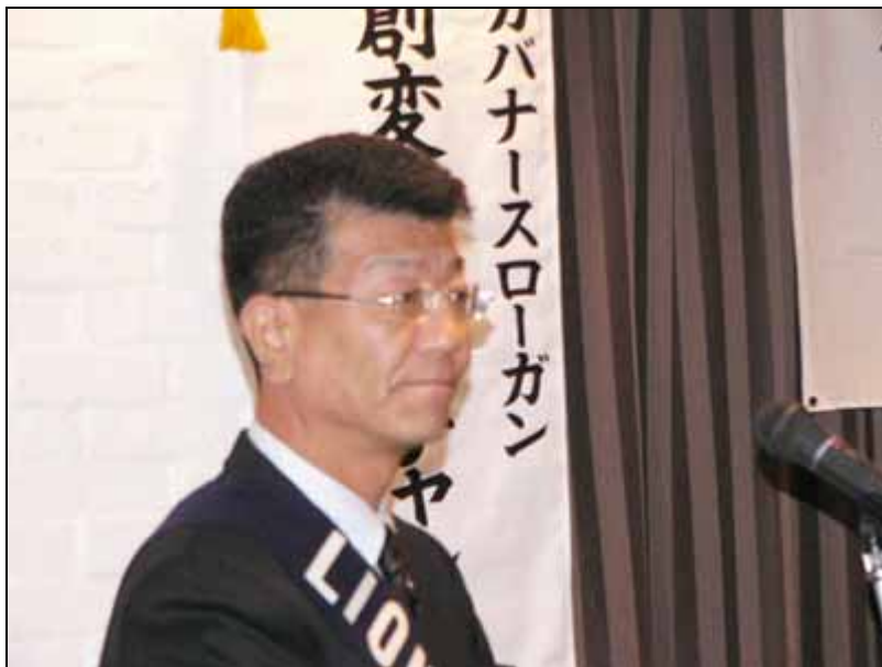
小北1日テーマによる進行