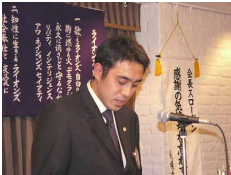
北嶋1日出席委員長による出席率の発表