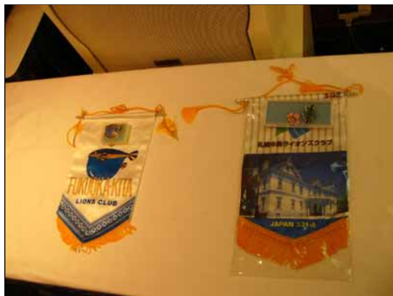
両クラブのバナー