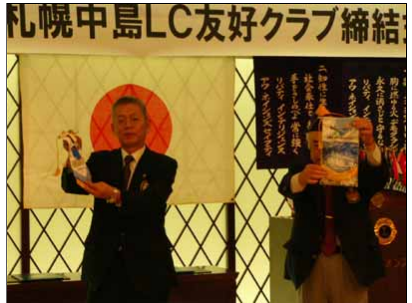
同じくバナーの交換