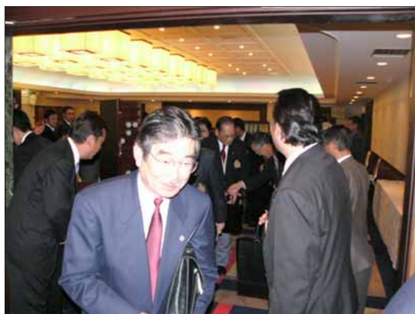
退場、青谷幹事「ご苦労様です」