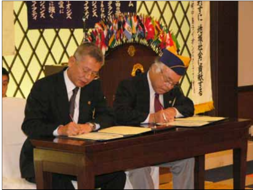
両会長による「締結署名」