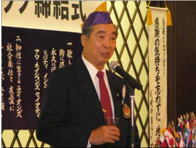
姉妹友好クラブ委員長、西村LのWe Serve