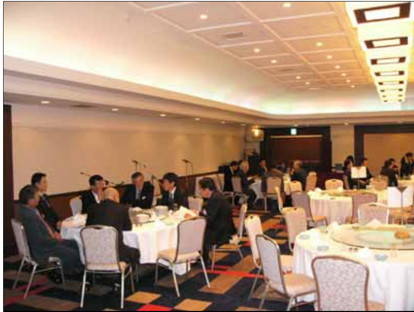
中島LCのメンバーも緊張気味にゲストを待ってます