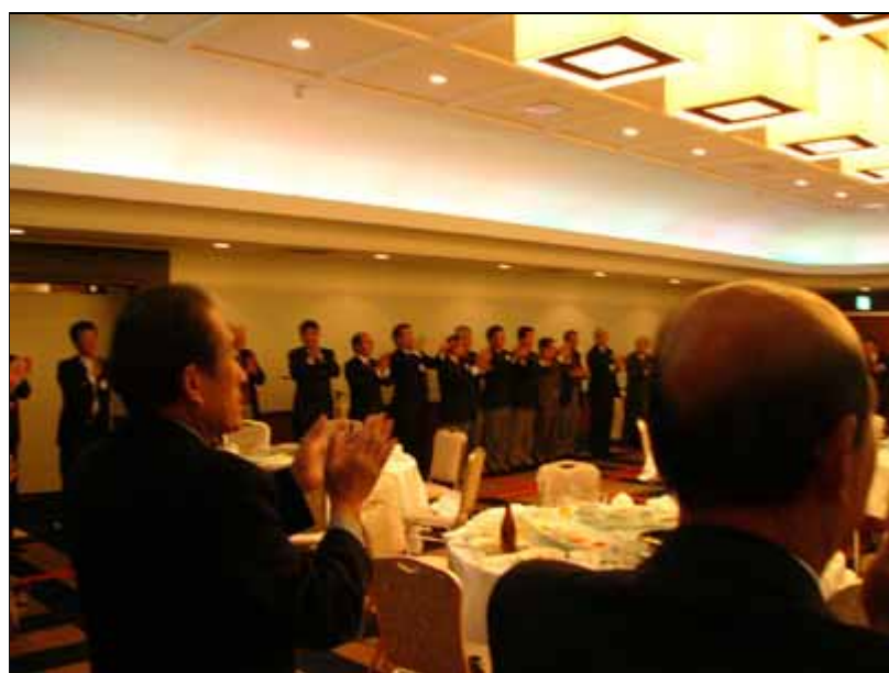
「また会う日まで」斉唱