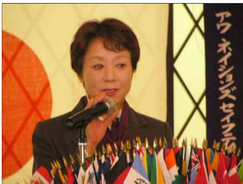
三谷実行委員長によるメンバー紹介