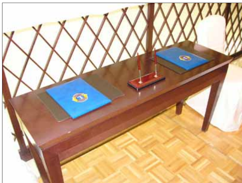
「締結書」の準備も万端です