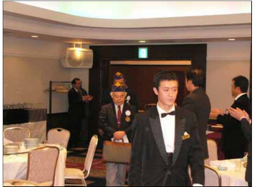
福岡北LCのメンバー来場