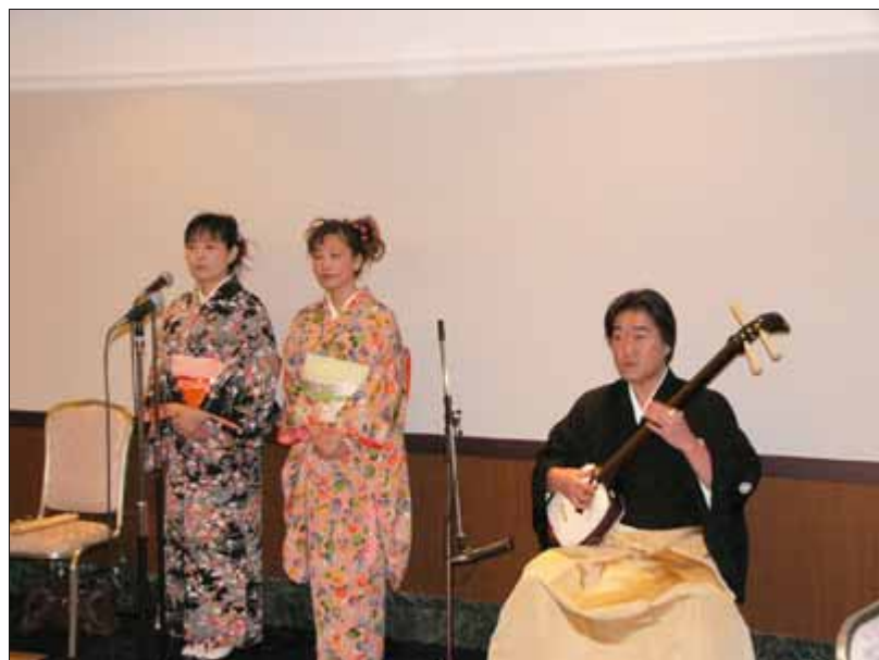
三味線の演奏で歓迎