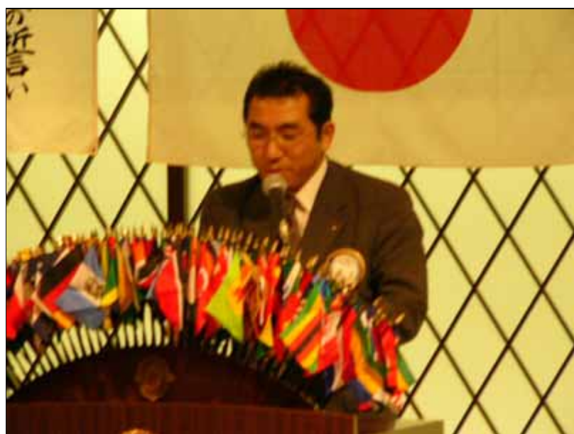
広野Lによる「審議事項」