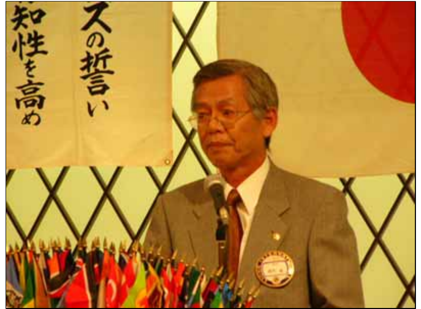
津村会長も緊張気味です