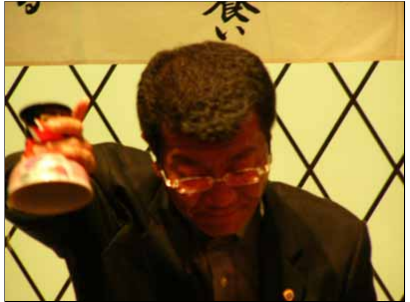
今回も優勝の小北Lの乾杯一気