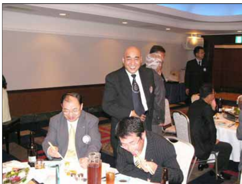
一際目立つ辻(博)L、無関心な蝶野L