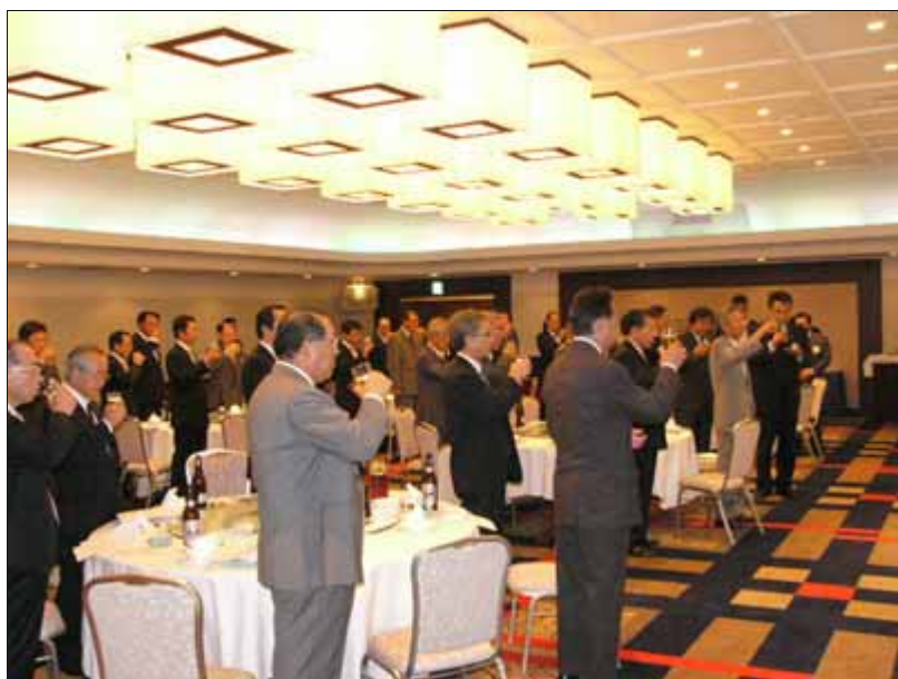
来場者全員で拍手