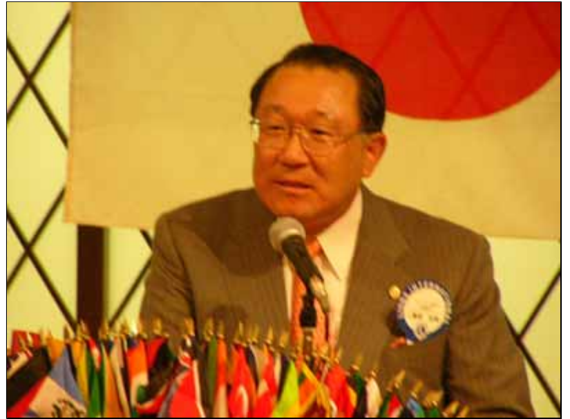
東LC庵原L(エクステンションメンバー)の挨拶