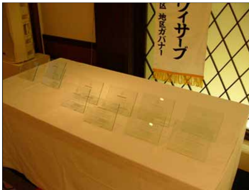
各ゲスト、CNメンバーに送る「盾」(鶴嶋LCのアイデアです)