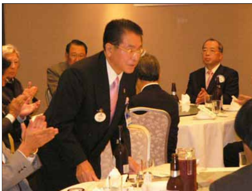
秋葉ガバナーの会釈