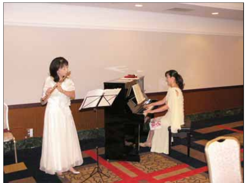
津フルートとピアノの演奏が場を盛りたてます