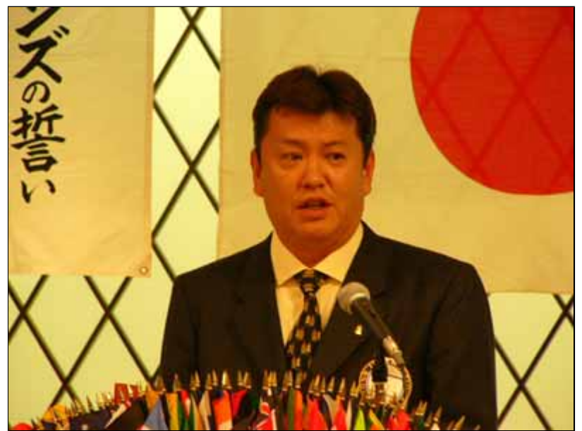
鶴嶋実行委員長による挨拶