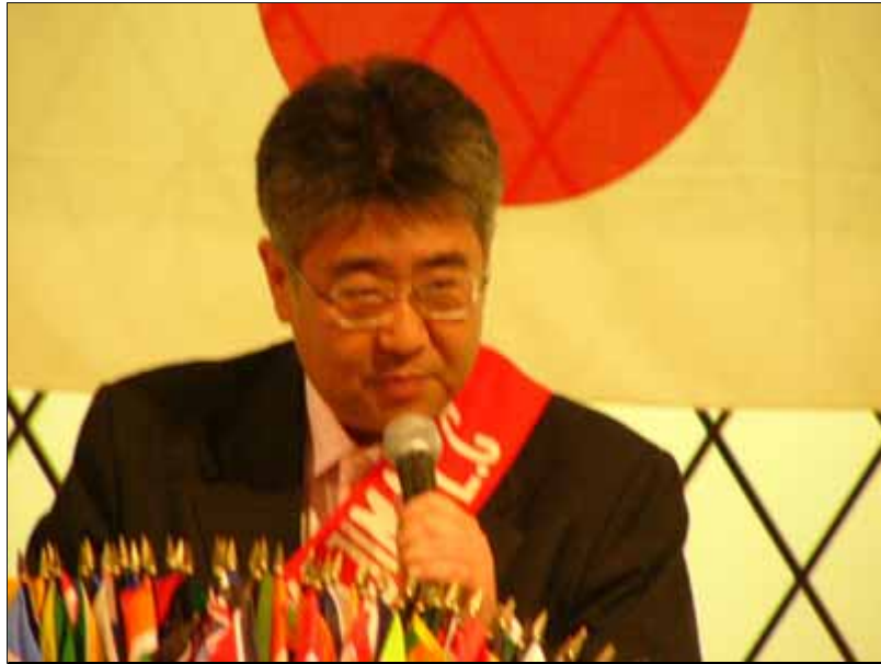
矢部Lによるテールツイスタータイム