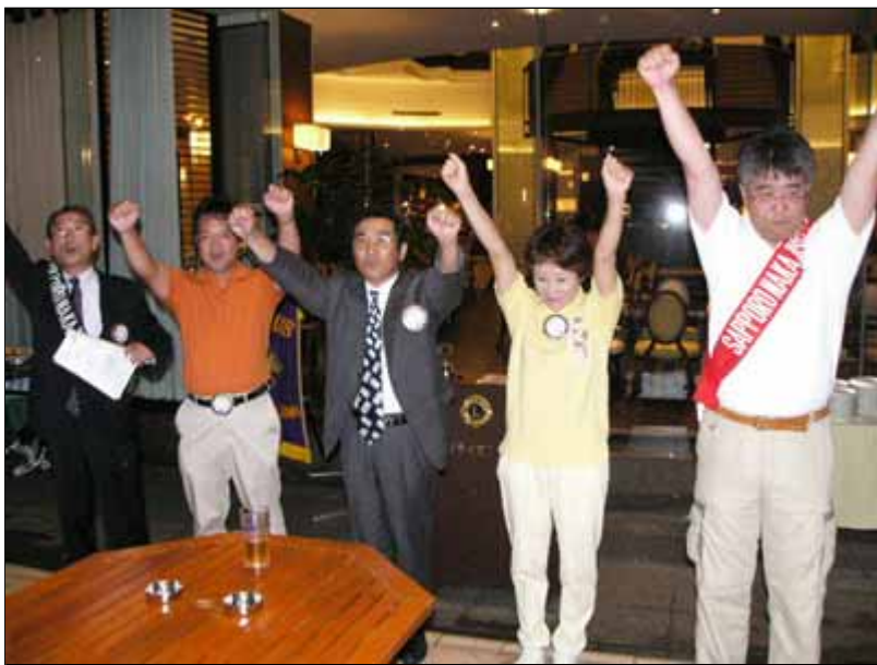
8月皆出席アワード