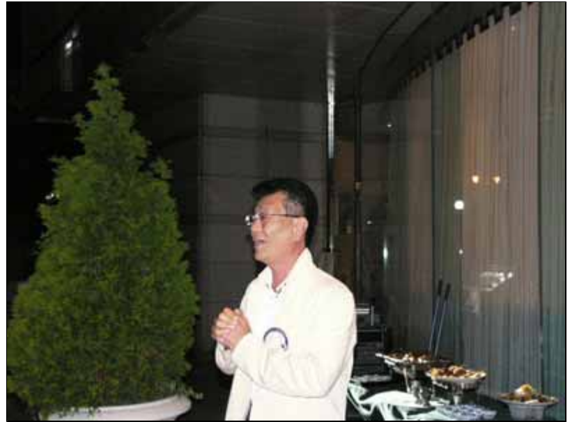
当日行われたゴルフ同好会の優勝者、小北Lのスピーチ