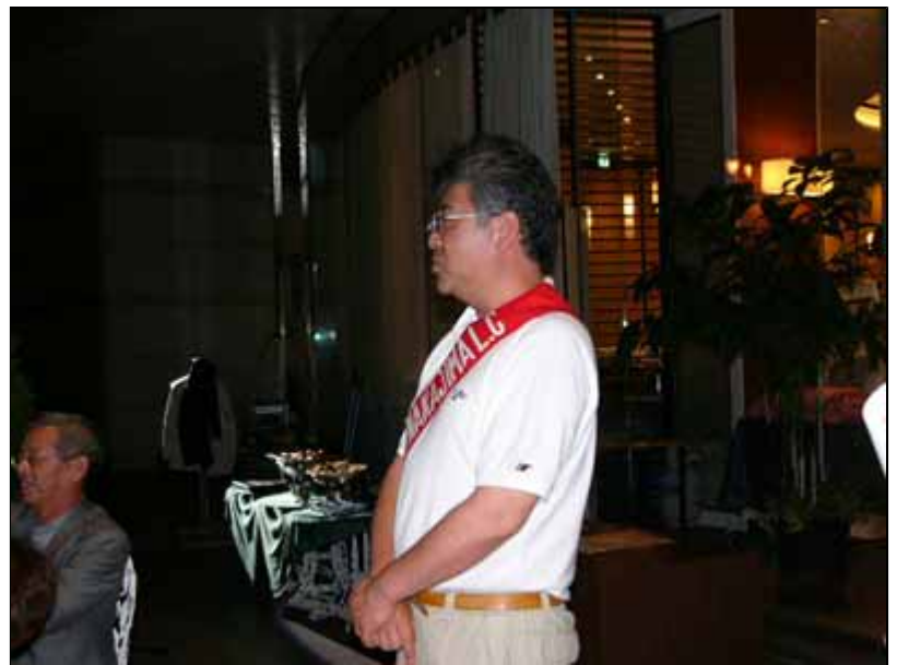
矢部テールツイスターによる「取り立て」