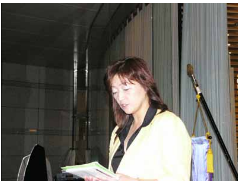
大瀧出席委員長による出席率の発表