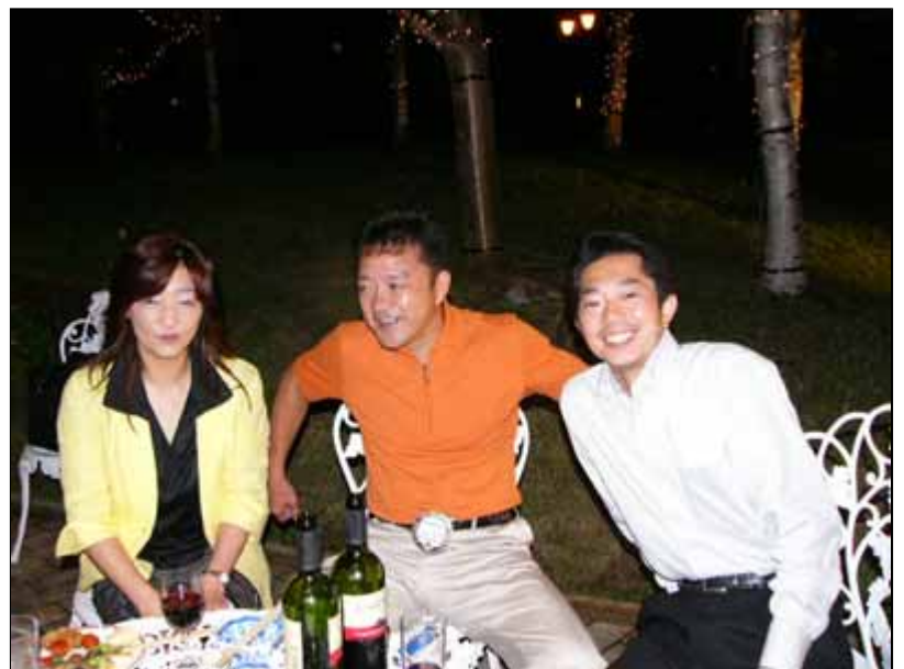
外でも爽やかな3人、大瀧L、山下L、橋本L