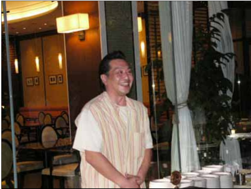
佐田Lも満面の笑み