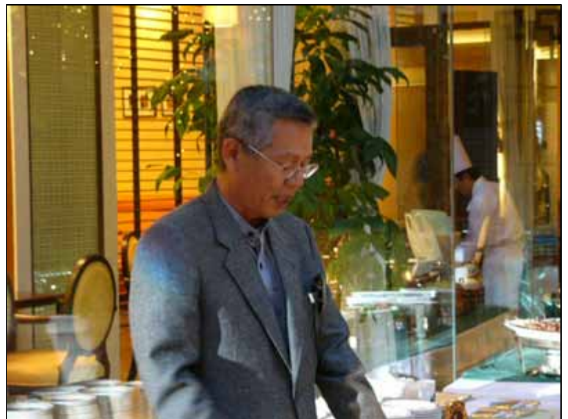
津村会長のゴング