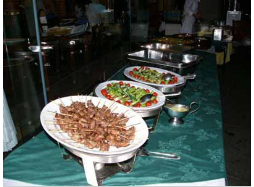
料理もアウトドア風に